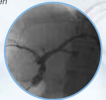
Dilatation einer Striktur mit einem Hurricane Dilatationsballon