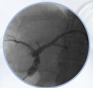
Dilatation d'une sténose avec le ballonnet de dilataion Hurricane