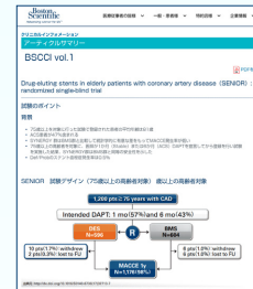
アーティクルサマリー WEB掲載版