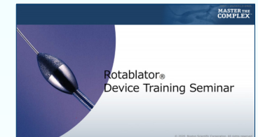
ROTABLATOR™ 施設認定用 製品トレーニング動画