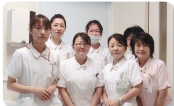
看護師のみなさん