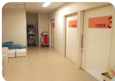
患者とスタッフの導線を分離