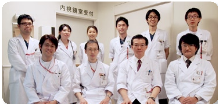
消化器内科の先生方