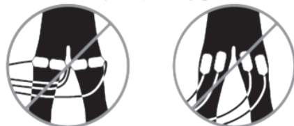
図2 不適切な配列状態

対極板の監視は安全のために、長時間の処置の場合は特に必要不可欠である。間違った対極板の装着を早期に検知して熱傷を防止するために、処置の開始時に監視を行う必要がある。また、処置中も剥がれたり、隙間が空いたり接続面の品質が低下したものを検知するために、監視が重要である。