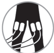
図1 適切な配列状態

本品を使用する際には、BSJディスプレイ対極板（導電部面積134 cm 2 、承認番号:22800BZX00368000）を使用すること。4つの対極板を使用し、両足大腿部に2つずつ配置して、対極板のプラグを本品に接続する。対極板の向きが適切か、また対極板の上端位置が揃っているか確認する（図1～2参照）。