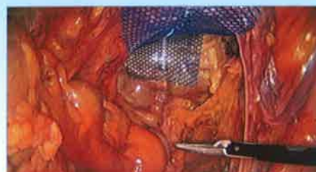
Figura 1: Imagem de dissecação posterior realizada com Colpassist Dispositivo de Posicionamento Vaginal fornecendo o posicionamento.