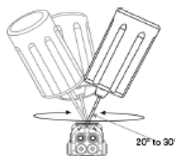
Vista lateral de la llave hexagonal durante la rotación.