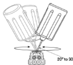
Seitenansicht während der Drehung.