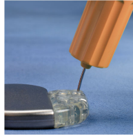
Abbildung 1. Schraubendreher um 20° bis 30° aus der senkrechten Position neigen.