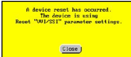
图 3. 起搏器重置信息。